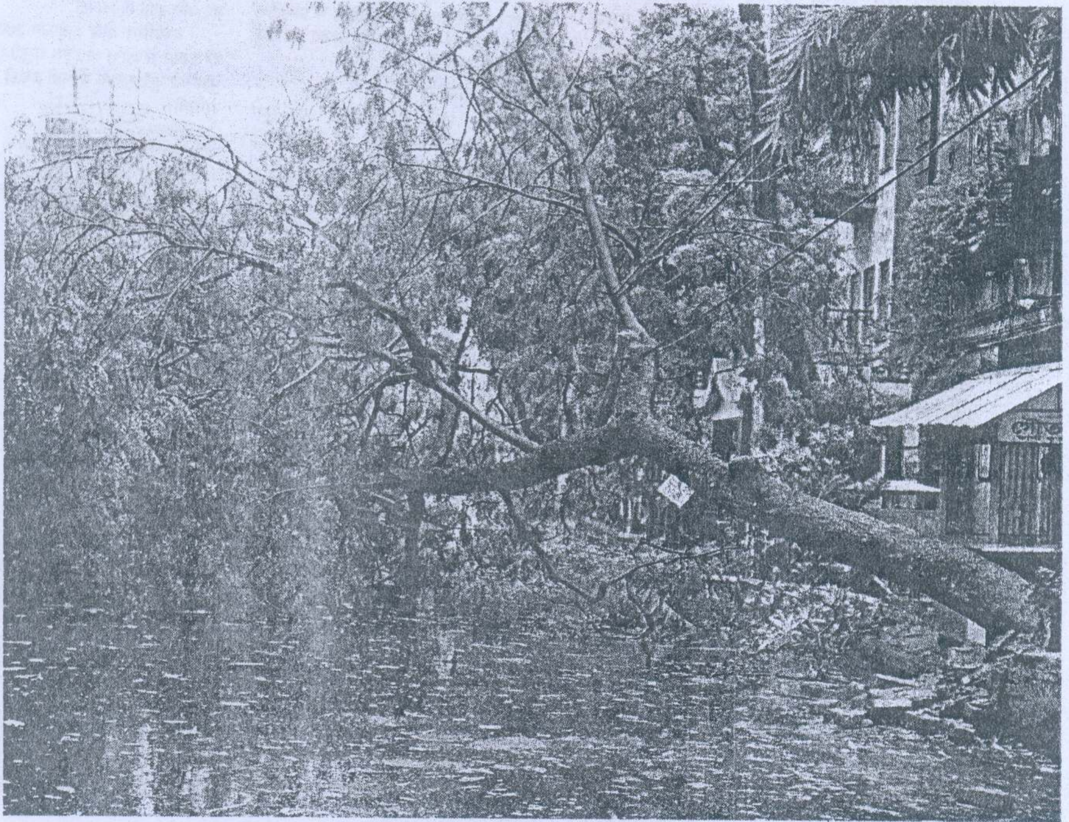
An uprooted tree on Vivekananda Road in Kolkata on Monday.

● ONE LAKH PEOPLE LOSE THEIR HOMES ● ARMY DEPLOYED IN WORST AFFECTED AREAS