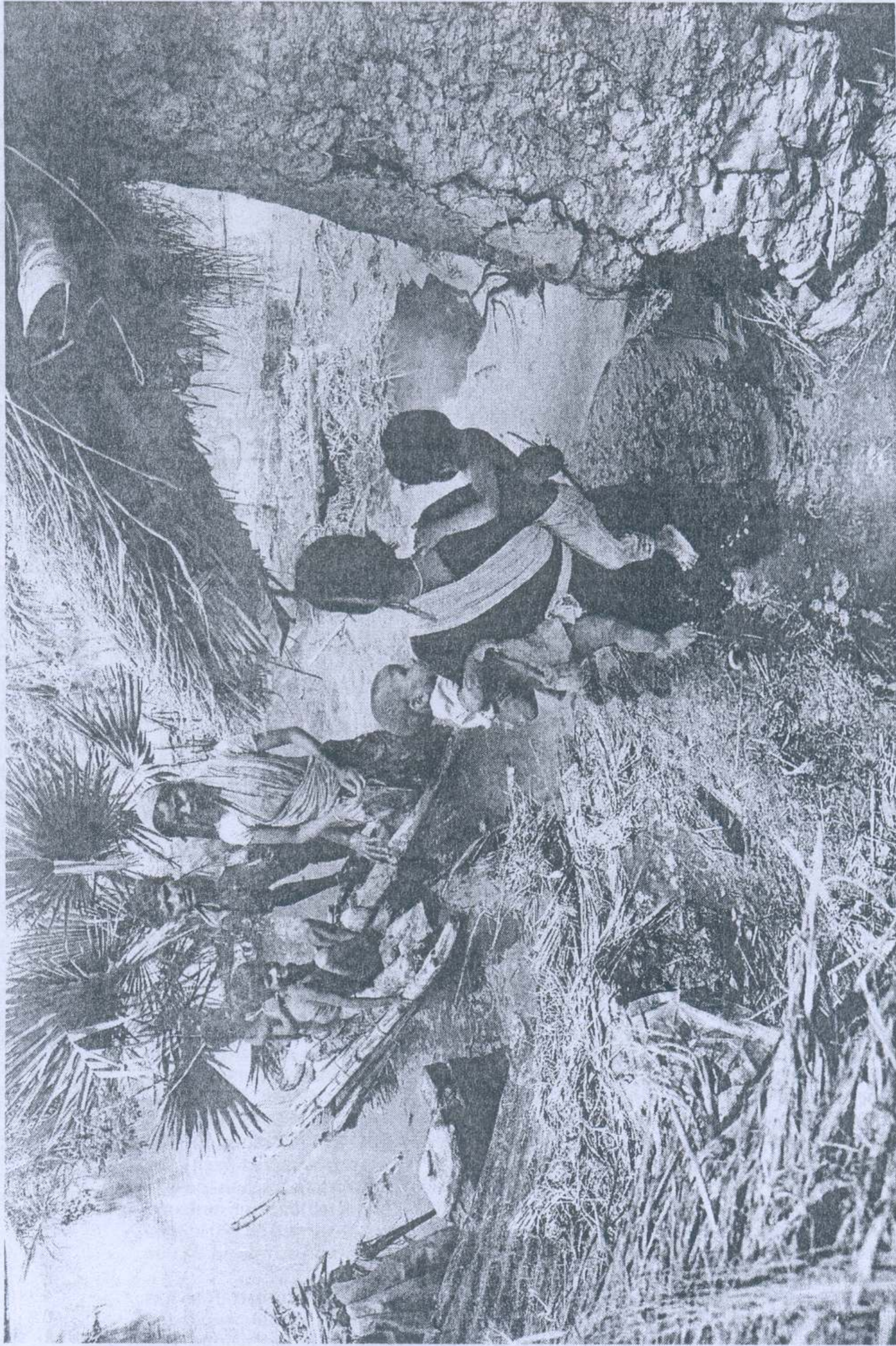
FLOOD OF WOES: Marooned villagers at Basanti in West Bengal's South 24 Parganas district move to safer places on Tuesday.

Army and Border Security Force personnel are assisting