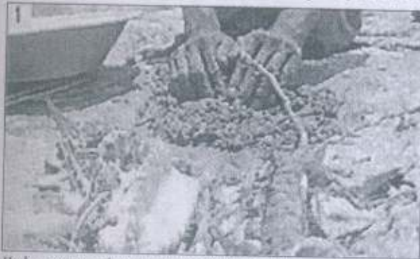
1 Herbs are ground to a paste and mixed with cow dung, urine

The forest mostly comprises sidha (benteak), jamun and khair (black cutch) trees. "Most trees in the forest have multiple trunks. They have grown from stubs of trees felled in the 1980s and were almost dead," he says. "The paste provides moisture and nutrition to the stub and helps it regenerate. It takes a long time, eight to 10 years, for shoots