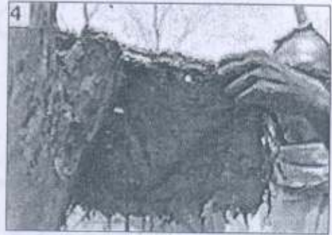
4 The tree absorbs the mix while the jute cloth decomposes