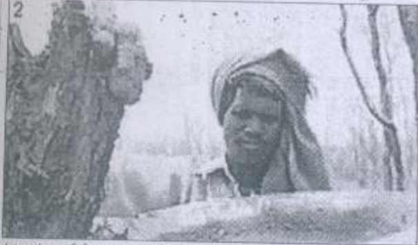
2 A portion of the paste is then applied on a stub